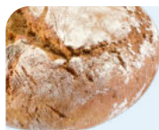
ржаной ферментированный хлеб