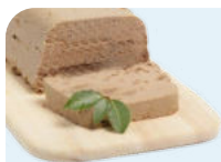
паштет из рыбы (лучше домашний)