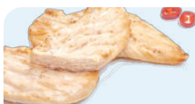
белое мясо (курятина, индейка)