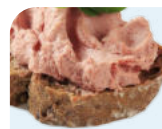
печеночный паштет (лучше домашний)