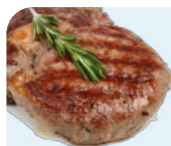
красное мясо (телятина)