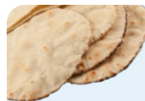
лаваш из цельнозерновой муки