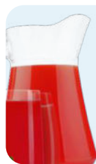
домашний морс без сахара