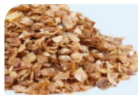
горсть гречневых хлопьев