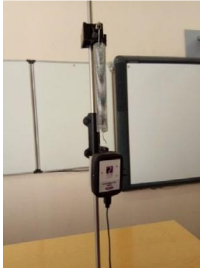
Рис. 1. Экспериментальная установка

2. Соберите экспериментальную установку по рисунку 1. Для этого установите штатив и закрепите пружину с подвешенным на ней грузом. К грузу с помощью двухстороннего скотча прикрепите мультидатчик Физ 5, к которому подсоедините USB-провод и подключите его к компьютеру.