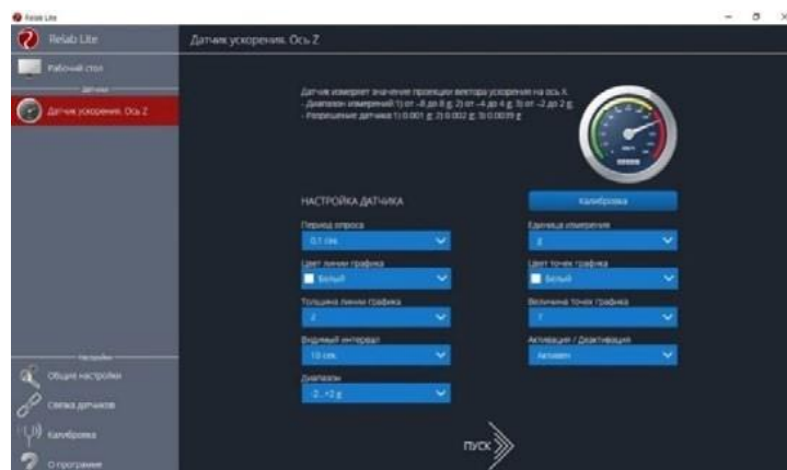
Рис. 2. Изменение параметров сбора данных

6. Измените параметры сбора данных. Задайте следующие параметры: период опроса: 0,1; видимый интервал: 10; диапазон опроса: от -2g до +2g (рис. 2).